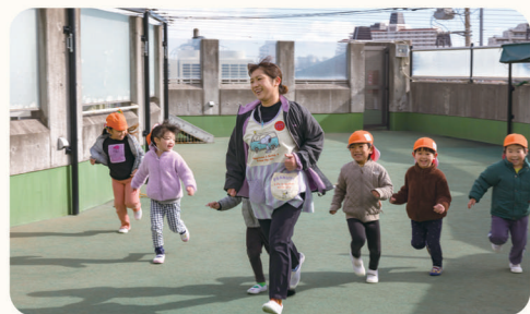
◀屋上でだるまさんがころんだ！

大海原に向かう船をイメージして造られた、明るく開放的な扇形の園舎が自慢です。子どもたちが安心して過ごせる環境を大切に、たくさんの「ドキドキ」「わくわく」を届け、「だいすき」が見つけられるよう共に進みましょう。